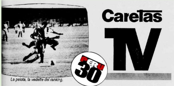
La pelota, la vedette del ranking.