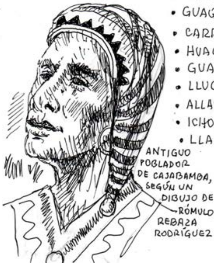
ANTIGUO POBLADOR DE CAJABAMBA, SEGÚN UN DIBUJO DE RÓMULO REBAZA RODRÍGUEZ

(García de Villalobos: 1611- Padrón de Tributarios 1680)