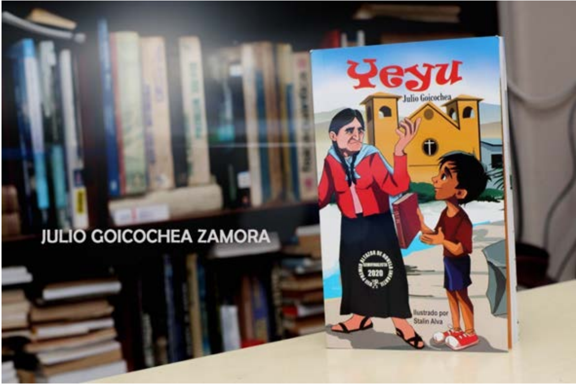
JULIO GOICOCHEA ZAMORA