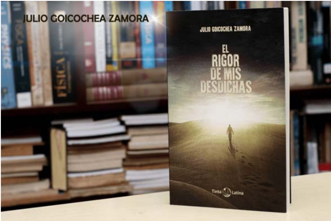
JULIO GOICOCHEA ZAMORA