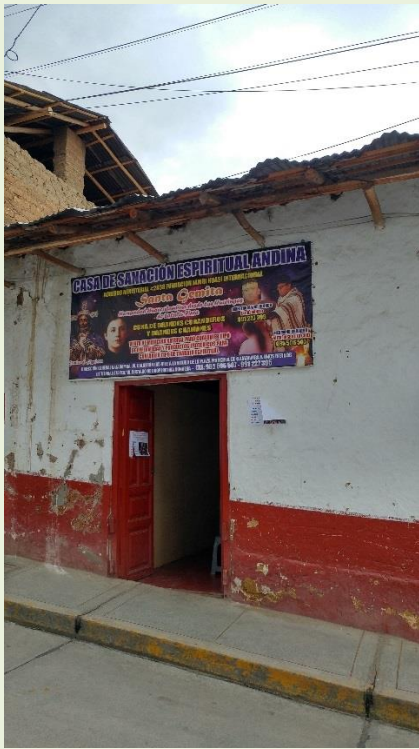
Local de curandero en Cajabamba