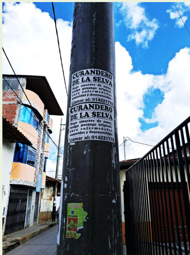
Publicidad de curandero en Cajabamba