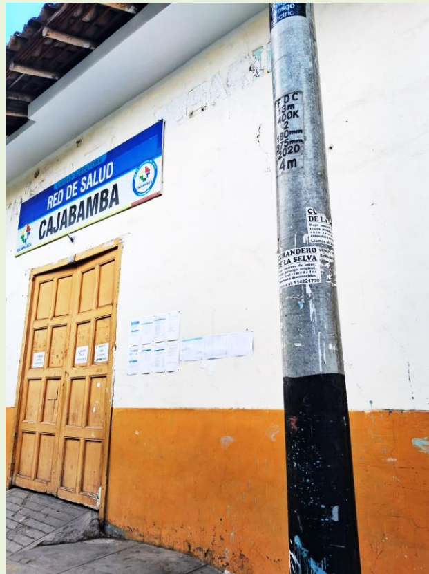
Publicidad de curandero en Cajabamba