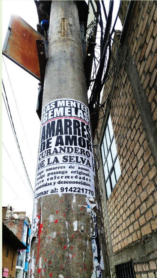
Publicidad de curandero en Cajabamba