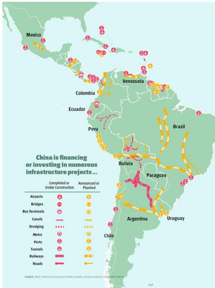
Inversiones chinas en América Latina (2021)