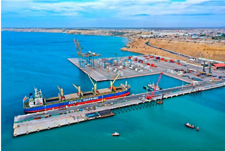
Puerto de Chancay